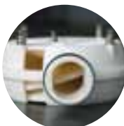
Nutating disk system