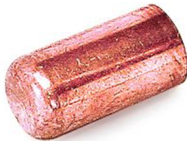
VCG 290, Stopfen