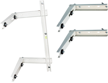
Befestigung MCE für Klimaanlage