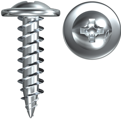
Profilverbindungsschraube ohne Bohrspitze