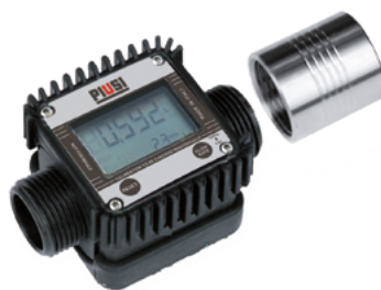
K24 IN KUNSTSTOFFAUSFÜHRUNG