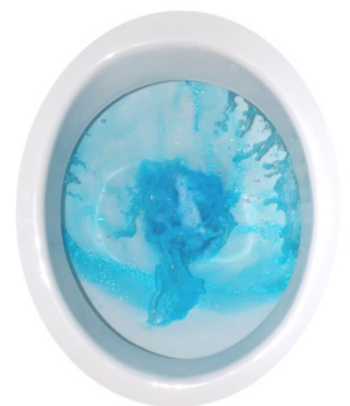
WC Becken beim Spülvorgang

Der WC-Star wird kinderleicht mit nur wenigen Handgriffen im Spülkasten eingehängt. Kein bohren, kein kleben, kein umständliches hantieren, Deckel vom Spülkasten entfernen, freien Platz finden und einhängen.