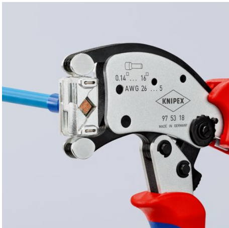
Einmalig flexibel: Verbinder können aus nahezu jeder Position in den drehbaren Crimpkopf eingeführt werden