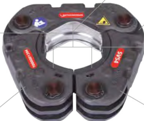
Abb. Pressschlinge SV54

Synchroner Lauf der Backenhebel ermöglicht das Öffnen der Backe mit einem Finger