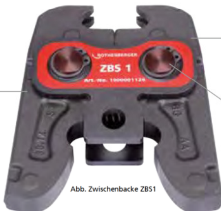
Abb. Zwischenbacke ZBS1

Öffnen der Schlinge um bis zu 180° ermöglicht die Montage auch an schwer zugänglichen Stellen