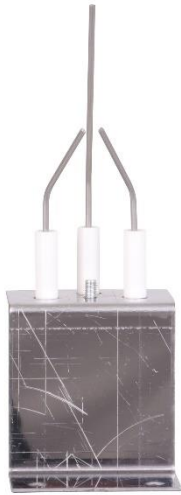
Abb 3. Rückansicht