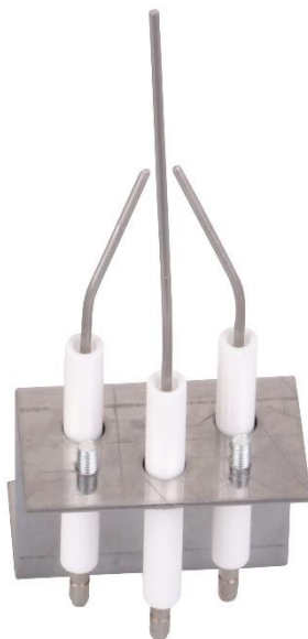
Abb 1. Vorderansicht

Nach erfolgreichem Biegen und schneiden sieht der Block dann folgendermaßen aus.