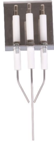
Abb 4. Ansicht von Oben