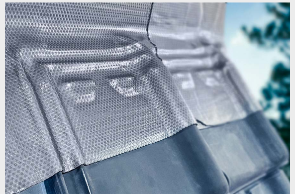
Das Material ist so formbar, dass sich auch Details der Eindeckung herausstellen lassen.