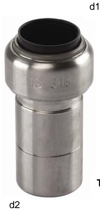
TS 243, Reduziernippel