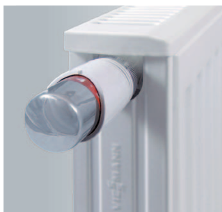
Detailabbildung: Design-Abdeckgitter sowie Seitenblech mit Viessmann-Schriftzug