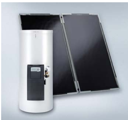
Vitosol 141-FM –

Solarpaket zur solaren Trinkwassererwärmung mit bivalentem Speicher-Wassererwärmer einschließlich Solar-Divicon, Solarregelung, Sonnenkollektoren und Solarkomponenten