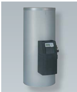
Vitocell 100-B mit vormontierter Solar-Divicon

Vitosol 100-FM (Typ SVKF) für Aufdachmontage Vitosol 100-FM (Typ SVKG) für Indachmontage