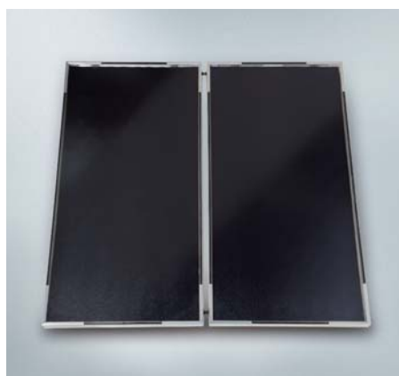
Flachkollektoren Vitosol 100-FM (Typ SVK)

Durch die Kombination von Solarthermie mit einem Wärmeerzeuger kann in der Regel die Energieeffizienzklasse A+ für das komplette Energiesystem erreicht werden.