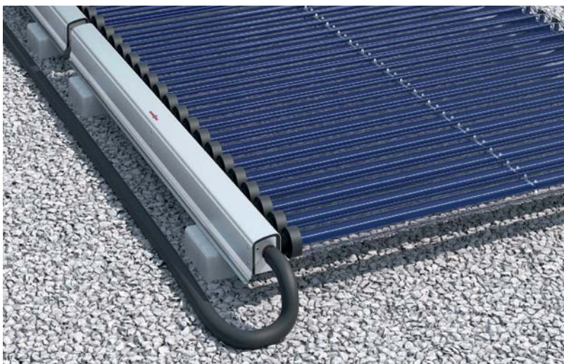
Vitosol 200-TM Vakuum-Röhrenkollektor mit ThermProtect

Im Servicefall können die Röhren dank Trockener Anbindung auch bei befüllter Anlage schnell, kostengünstig und einfach ausgetauscht werden.