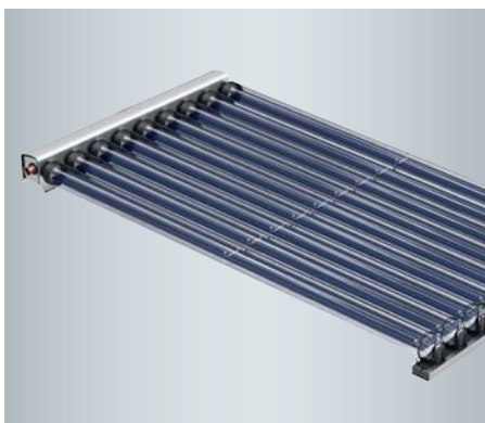
Vitosol 200-TM (Typ SPEA)